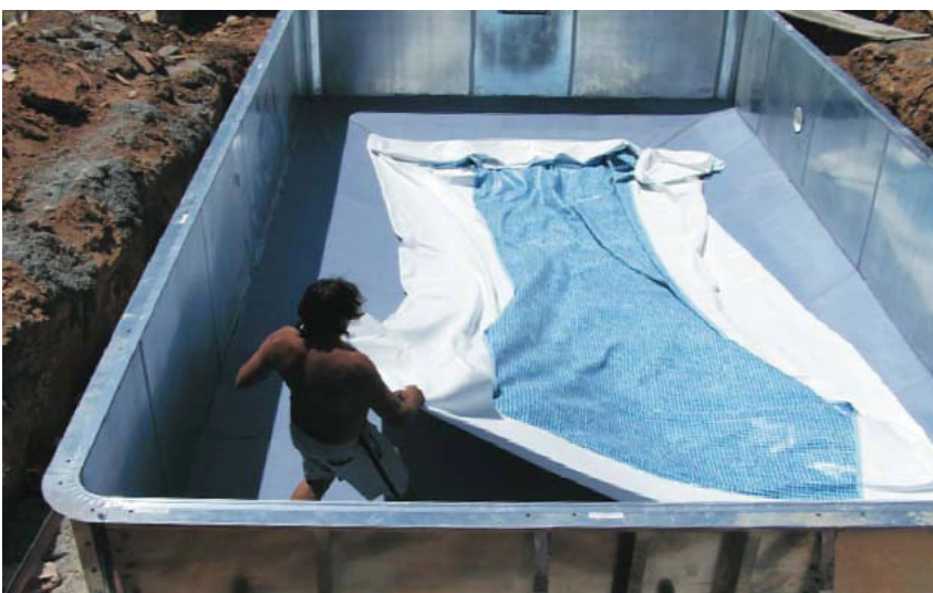
Utbretting av bassengduken i senter av bunn.

Tekst og bilder er ikke tillatt å kopiere uten samtykke av Partnerline AS !