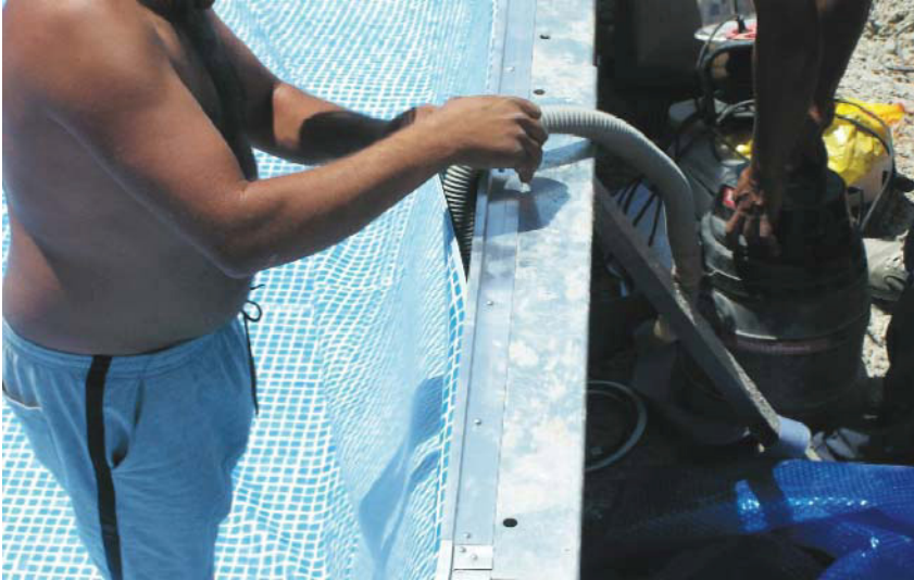
Montering av støvsuger for vakuumsug. Her vist mellom vegg og liner på en langvegg.