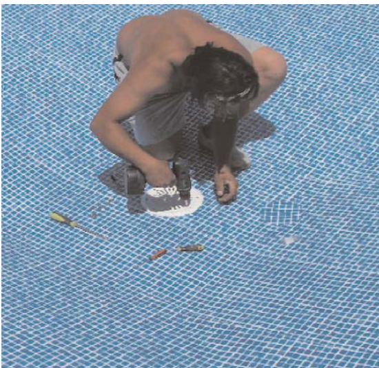
Montering av bunndren i bunnen av bassenget. Pass på å tette godt med pakninger.