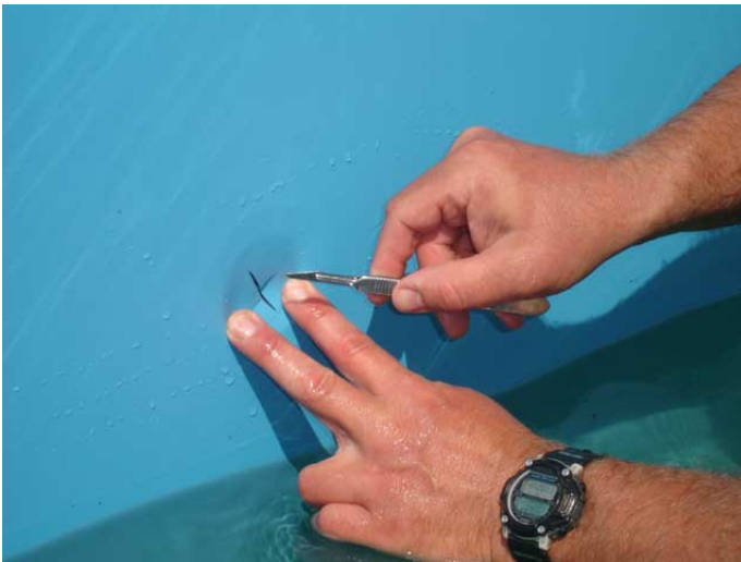
Montering av dyser i bassenget. Skjær ett kryss i senter.