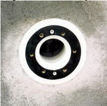
Viser dyse som er påsatt selvklebende pakning med matsjende hull.

6. Pakninger til komponenter: Lim på alle pakninger som skal være mellom vegg og bassengduk. Sørg for at hullene matsjer.