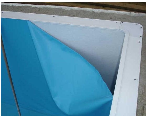
Montering av bassengduk i festelister med hjørne av liten radie.