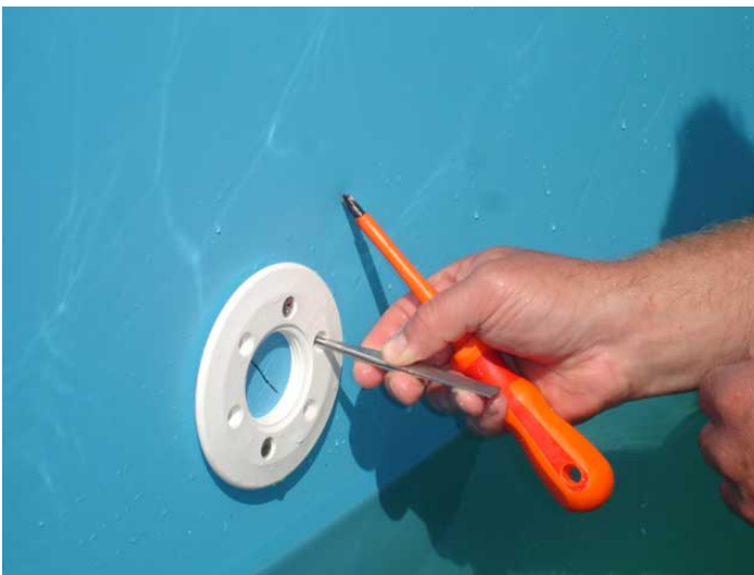
Montering av dyser i bassenget. Bruk en \varnothing 3-4mm dor å matsj hullene i innstøpningsdel og festeramme. Pass på at det ligger pakning bak !