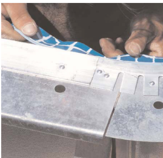
Montering av bassengduk i festelister med hjørne av stor radie.