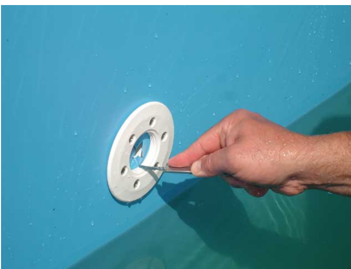
Montering av dyser i bassenget. Skjær vekk restduken slik at hullet blir fritt. Monter til slutt ytre dysehode. Samme prosedyre brukes på lys og motstrøm.