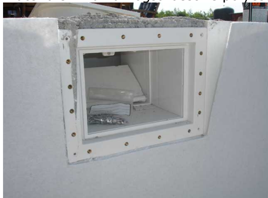
Underlagsfilten kappes til slik at den ligger mot flenser.

Filten anbefales påsmørt soppdreper (fås kjøpt hos byggvarehandleren) som en ekstra forsikring. Soppdreper kan være aktuelt dersom underlaget er av trematerialer eller andre organiske materialer. Du kan også bestille polyester filt fra Partnerline AS.