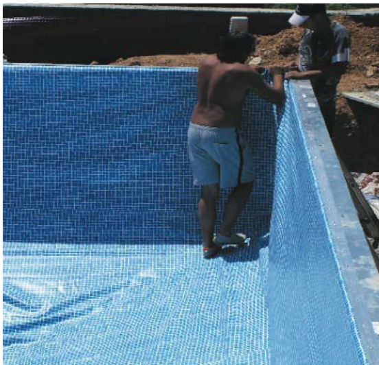
Montering av bassengduk i festelister.