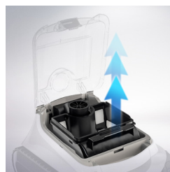
Filterbeholder med stor kapasitet på 4 liter